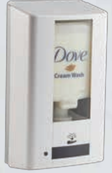
Hybrid dispenser Hem köpük hem manuel ürün kullanımı